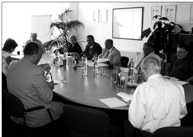
Jednání Valné hromady