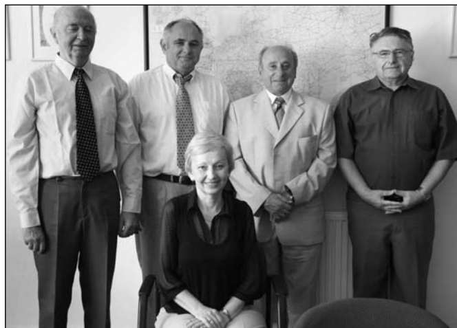
Správní rada společnosti

LETOS SLAVÍME 125. VÝROČÍ VÝROBY PRVNÍCH PAPÍROVÝCH DUTINEK